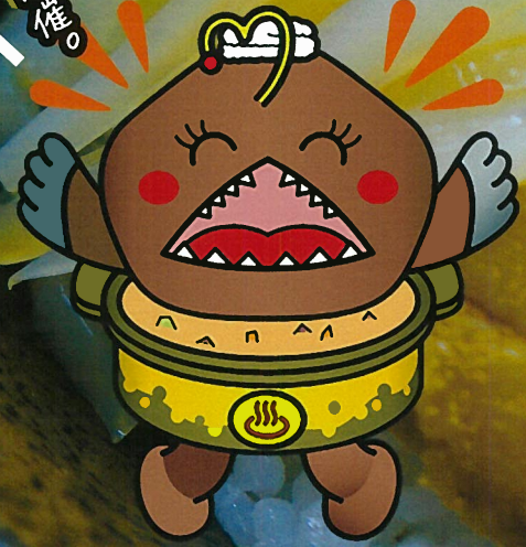
風間浦村イメージキャラクター「あんきもん」