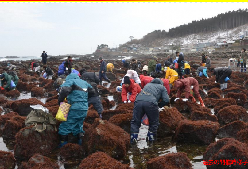
過去の開催時様子

冬 の風物詩「布海苔採り体験」開催！！ 風間浦村の 今が旬 な特産品を 採ることができる 今しかできない 体験