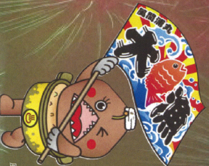
風間浦村マスコットキャラクター あんきもん